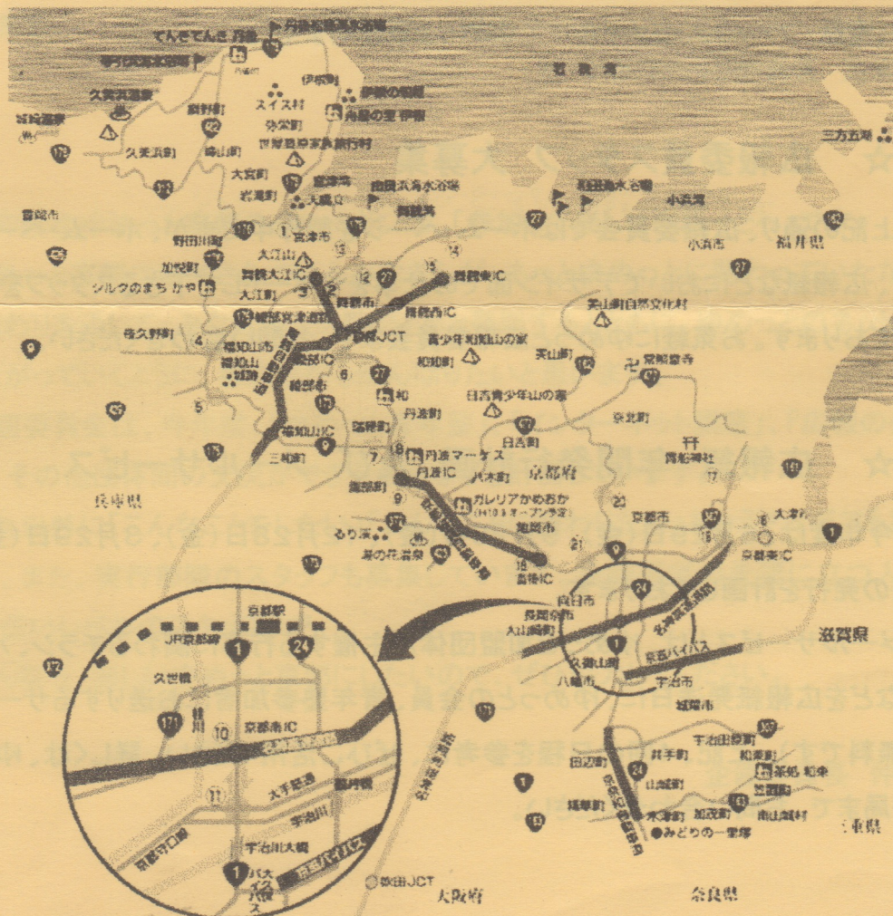
渋滞予測マップ(京都府:海水浴・帰省)