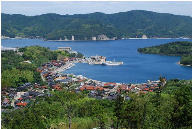
菱浦湾…ラフカディオ・ハーンが鏡のように穏やかであったので「鏡ヶ浦」と命名。

さざえカレー、岩ガキ、隠岐牛、海士乃塩などの島ブランド商品の開発 徹底した行財政改革 移住者の受け入れ支援